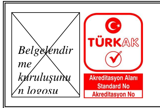
Şekil 6: Belgelendirme Kuruluşunun Logosu ve TÜRKAK Akreditasyon Markasının ilgili Sertifikada Kullanım Şekli