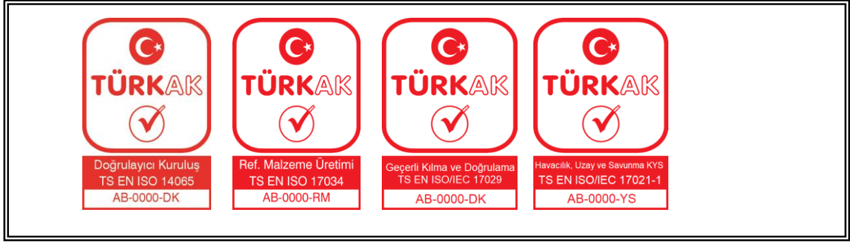
Şekil 5: TÜRKAK Akreditasyon Markası Örnekleri